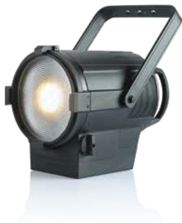
Угол луча 17°